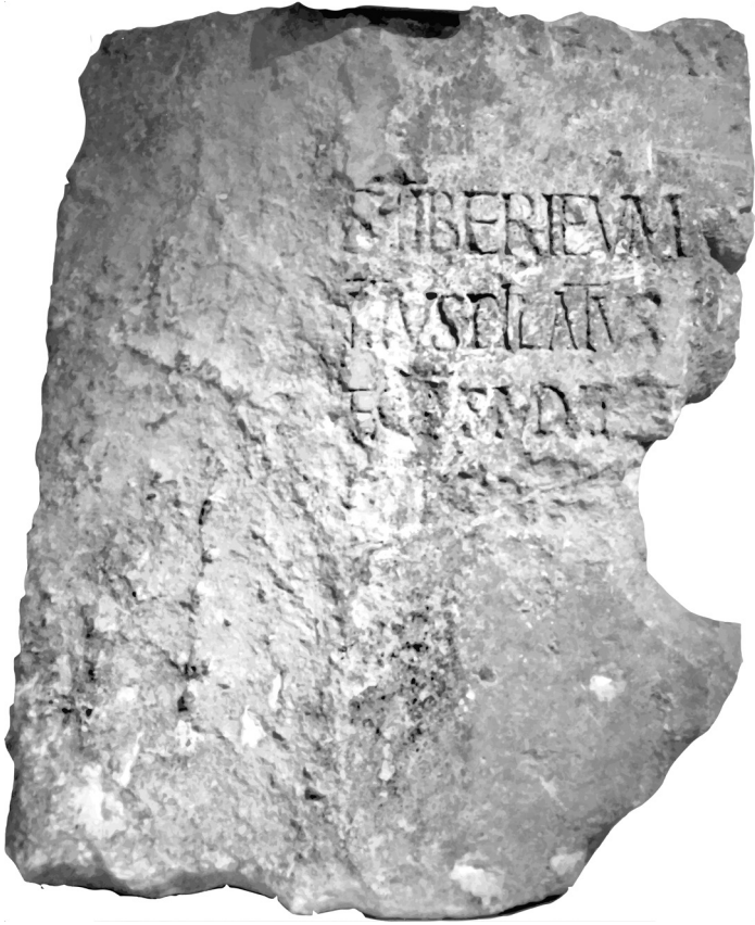
본디오 빌라도 비문. 가이사랴에서 발견된 본디어 빌라도 비문에는 가이사랴에서 티베리우스 Tiberius 황제 시절에 본디오 빌라도 Pontius Pilatus 가 근무했다는 것이 적혀있다.

는 않습니다. 이것도 일종의 결단이 필요한 일입니다. 그런데, 뒤늦게 하나님을 알게 된 고넬료 는 대부분의 로마 사람들이 그러하듯, 철학 사조로서 “신”으로 하나님을 대하지 않고, 항상 기도하며 삶으로 하나님께 나아갔습니다. 그러기에 어찌보면, 지배자의 입장에서 혹독하게 다루거나, 또는 그렇지 않더라도 인격적으로 대하지 않을 수도 있었던 피지배자의 위치에 있는 유대인 가운데에서도, 어려움에 처한 이들을 도울 수 있었던 것이 아닌가 해요.