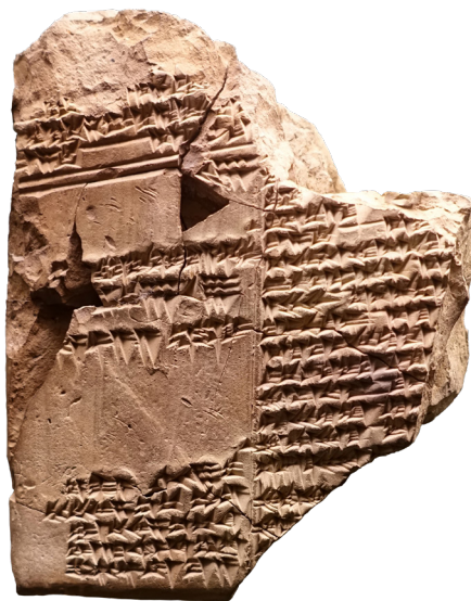
▲ 아트라하시스가 기록된 아카드어 토판

첫 세상은 신들만이 살던 시대였다. 신들에게도 지위가 있었는데, 지위가 높은 상급 신들을 '아누나키', 지위가 낮은 하급 신들을 '이기기'라고 불렀다. 이기기들은 아누나키의 종들처럼 일했다. 2,400년이 넘게 운하를 파고, 우물을 파는 일들을 했다. 이기기들은 이런 상황이 불만스러웠다. 그래서 아누나키들과 전쟁을 벌인다. 이때 아누나키 중의 하나인 에아(심연의 깊은 물을 다스리는 신)가 이기기의 노동이 힘든 일이니 이기기를 노동으로부터 해방을 시키고 대신에 인간을 만들어서 이기기들의 노역을 대신하게 하자고 제안한다. 에아와 닌투(어머니 신)는 신(웨일라-지혜의 신)의 피와 점토를 섞어서 사람을 만들었다. 창조된 인간은 이기기들이 하던 노역과 신전을 짓고 빵을 구워 바치며 신들을 먹이는 일을 감당하였다. 신들은 그 빵을 선물로 받고 역병, 가뭄과 같은 재앙을 멈추어 주었다.