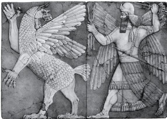
▲ 에누마 엘리쉬 중 티아맛과 마르둑의 전투를 묘사하는 부조

고대 서아시아 지역에서 인간과 신의 관계가 어떠한지를 보여주는 대표적인 이야기를 손꼽아 보라면, 에누마 엘리쉬와 아트라하시스가 손꼽힐 것입니다. 이 두가지 이야기는 인간 창조의 목적은 큰 신들을 섬기는 하급 신들이 될 수