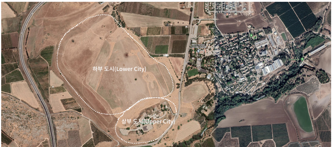
▼ 텔 하솔(Tel Hazor) 하부 도시는 대부분 농경지이다 (구글 지도 참조).

물도 풍족하고, 그 주변은 평지로 이루어져 있어서 농사를 짓기에도 최적의 장소이고, 고대 주요 도로(대간선 도로 Great trunk road)가 지나가는 홀라 골짜기에 위치해 있으며, 생